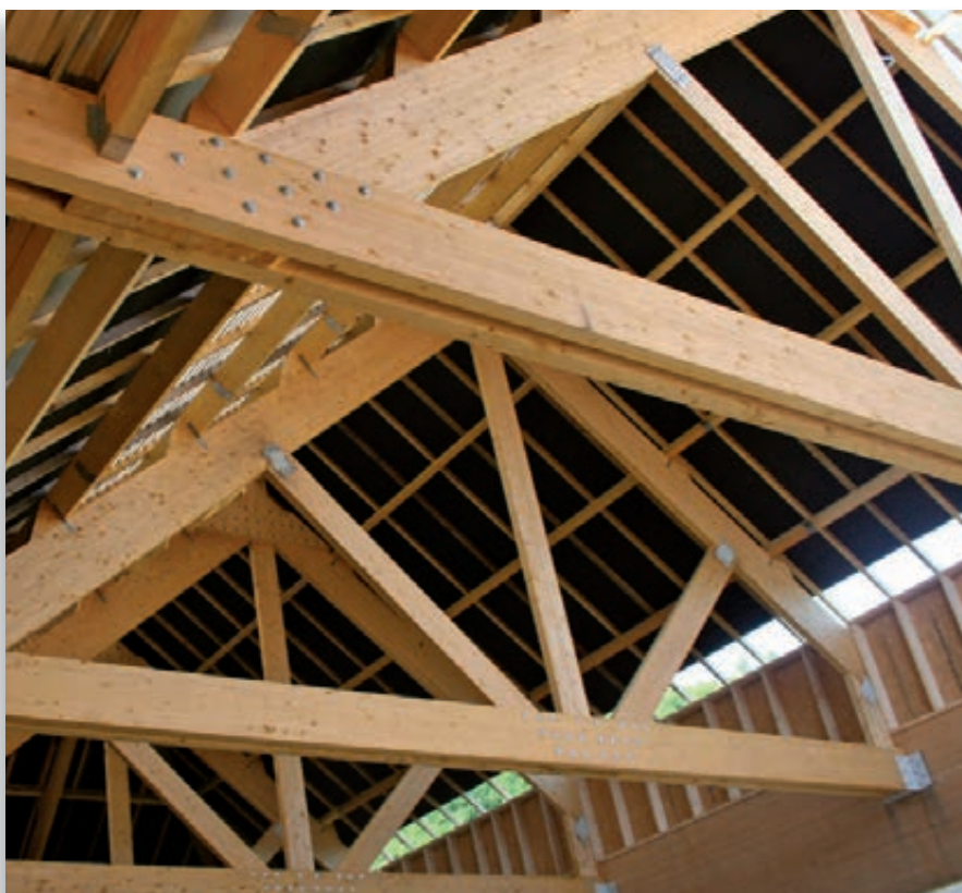
Fermes traditionnelles en lamellé-collé