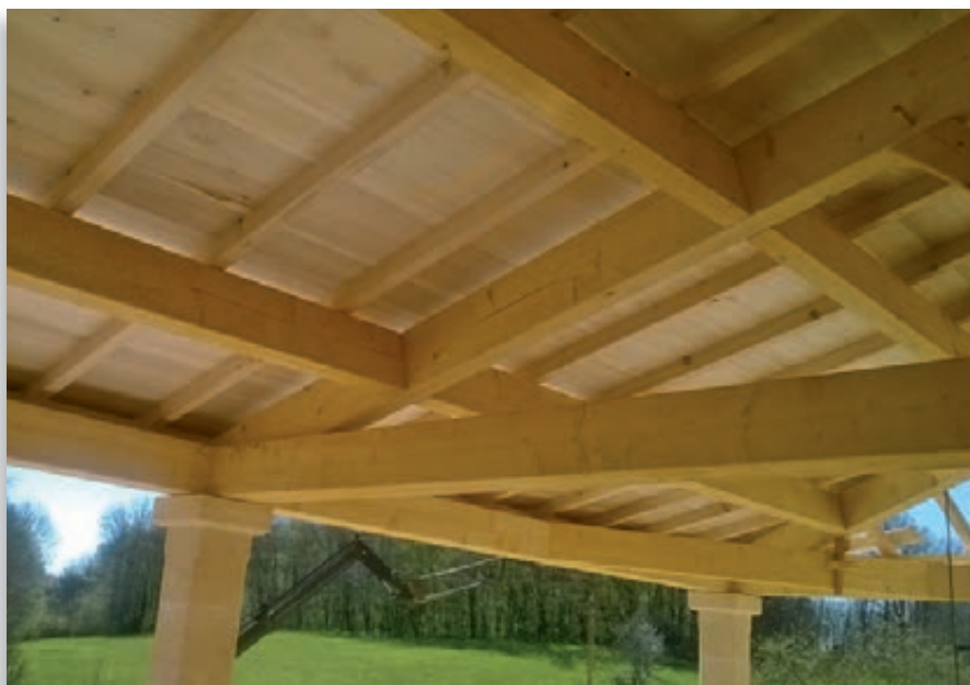
Charpente apparente en poutres contrecollées